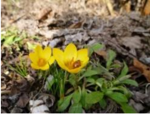
Linus Bröcker (2a), 1. Platz der 1./2. Klasse

dass es sicher nach dem Sommerferien den nächsten Fotowettbewerb geben wird, zu dem wieder jede Schülerin und jeder Schüler der ENS eingeladen ist. Dieses sind die diesmaligen Siegerfotos: