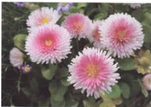
Lisa Raddatz (8a), 1. Platz der 7.-9. Klasse

Alle weiteren Fotos, die Preise errangen können auf